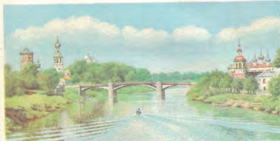
Волгогда. Октябрьский мост через реку Волгу

В Тотеме на здании школы, в которой он учился, установлена мемориальная доска