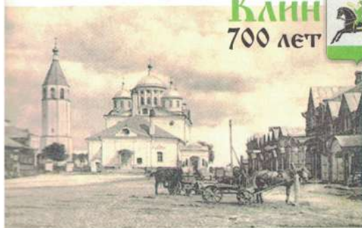
Рыночная площадь. Начало XX века