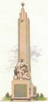
К 45-ЛЕТИЮ КУРСКОЙ БИТВЫ

Курская область. Памятник героям-саперам, погибшим в боях под Почепом