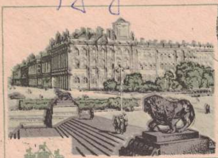
ЛЕНИНГРАД. Спуск к Неве на Адмиралтейской набережной